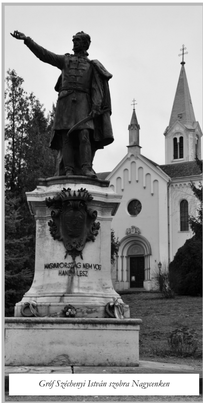
Gróf Széchenyi István szobra Nagycenken

Virrasszunk végre, nehogy rögtönzés, minden ok nélküli való gyanúsítás, ijesztgetés és durva erőszak legyenek a megbecsült hazafiság jelei, hanem csak a túrnitadás, mérséklet, józan tapintat és mély bölcsesség nyerje bérül a polgári érdemkoszorút!”